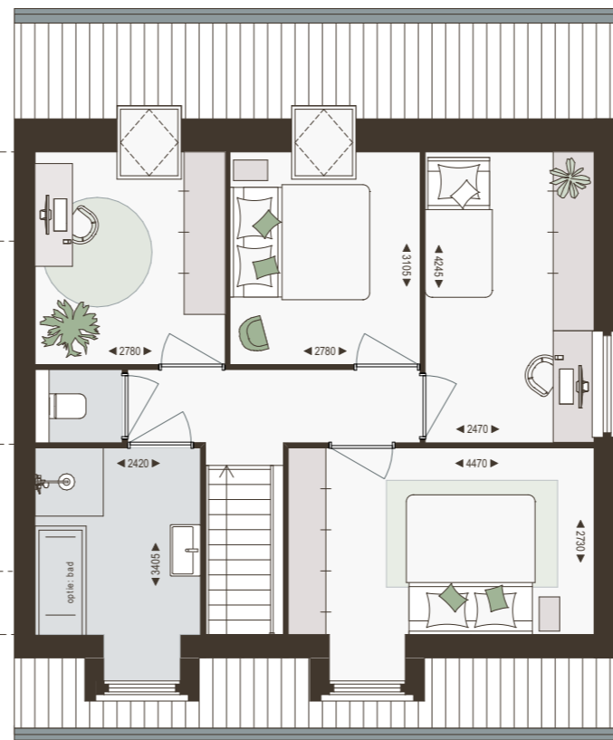
1e verdieping 1:100