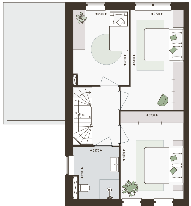
1e verdieping 1:100