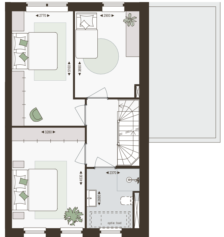
1e verdieping 1:100